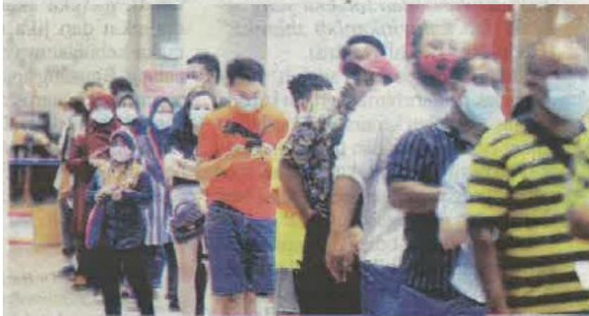
Harga runcit siling baharu RM1 seunit untuk pelitup muka tiga lapisan dikuatkuasakan mulai 15 Ogos bagi membantu meringankan beban rakyat.

Ia bagi membantu mengurangkan beban rakyat berikutan arahan kerajaan yang mewajibkan pemakaian pelitup muka di tempat awam bermula 1 Ogos susulan kes coronavirus (Covid-19) positif yang meningkat. -Bernama