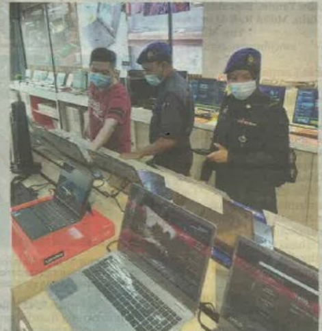
KOMPUTER riba dan mesin pencetak mencatat jualan tinggi.

"Sebanyak 10 notis dikeluarkan terhadap peniaga bagi membekalkan perincian harga jualan dan harga kos barangan bagi tujuan siasatan lanjut samada berlaku pengambilan keuntungan berlebihan atau tidak,"