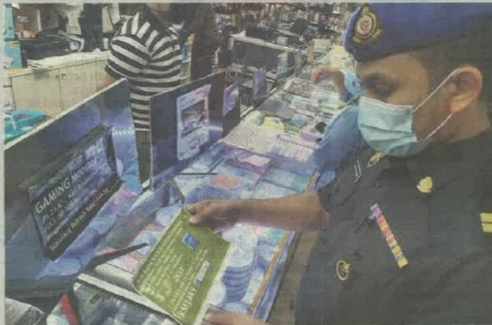
ANGGOTA penguat kuasa KPDNHEP melakukan pemeriksaan harga barangan elektronik menerusi Op Catut 8.0 di sekitar Shah Alam, semalam.

Katanya, tindakan itu diambil hasil pemeriksaan bermula 11 pagi di kios pasar raya di seluruh negeri