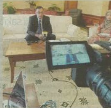
Rosol pada sidang akhbar di kementerian yang disiarkan secara langsung menerusi laman Facebook KPDNHEP pada Selasa.

al, pengagihan bayaran tersebut akan diselesaikan sepenuhnya pada April.