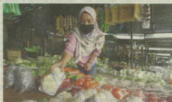
Kenaikan harga yang tidak terkawal tersebut bukan sahaja dapat menghakis kuasa beli rakyat, namun boleh menyebabkan ekonomi menjadi lebih teruk ditambah dengan pelaksanaan PKP.