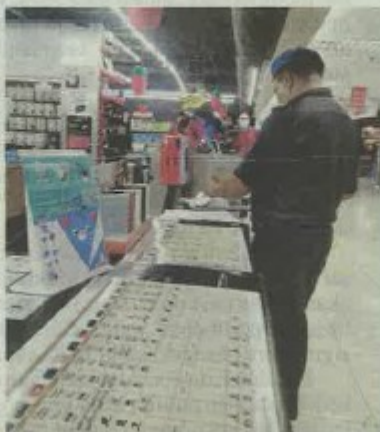
Pemeriksaan dilakukan penguatkuasa KPDNHEP di beberapa premis menjual barangan elektronik sekitar Kota Kinabalu, Sabah sejak Selasa.

"Selain itu, tindakan pemeriksaan yang dilakukan bertujuan memantau