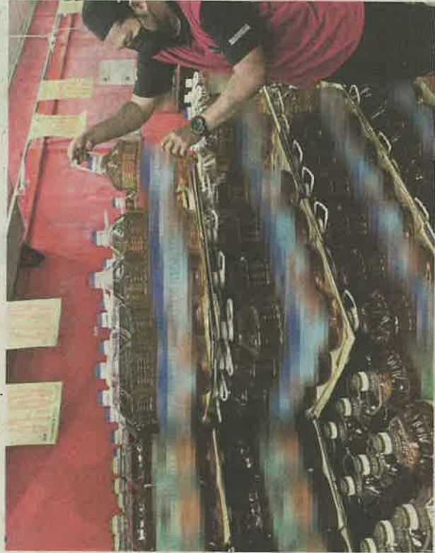
Kerajaan mencari kaedah terbaik menentukan harga minyak masak tidak membebankan pengguna. (Foto hiasan)

Sementara itu, Mohd Khairuddin berkata, menteriannya turut mencadangkan pelaksanaan mekanisme jangka panjang atau subsidi bersasar minyak masak seperti sedang dilaksanakan bagi petrol ketika ini, kepada kerajaan.