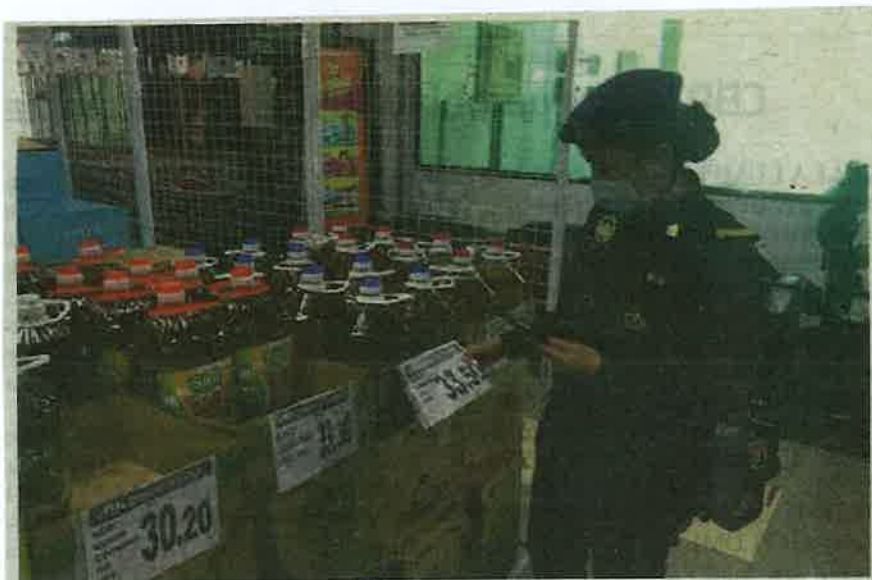
Pemeriksaan minyak masak sedang dilakukan.