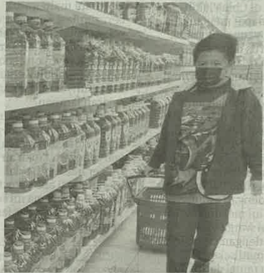
KENAIKAN harga minyak masak dalam tempoh penularan pandemik Covid-19 memberi kesan kepada pengguna.

Pensyarah Kanan Fakulti Pengurusan & Perniagaan, Fellow Institut Kepimpinan & Pembangunan, Universiti Teknologi Mara (UiTM)