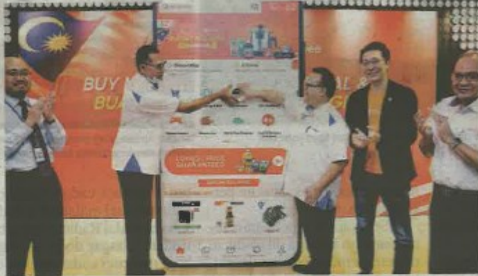
Menteri Perdagangan Dalam Negeri dan Hal Ehwal Pengguna, Datuk Alexander Nanta Linggi (tengah) ketika melancarkan Majlis Kempen Beli Barangan Malaysia di ibu pejabat Shopee, Kuala Lumpur pada tahun lalu.

"Dengan menggabungkan maklumat yang relevan dan dana untuk penjual dari rakan kongsi kami, disertakan dengan rangkaian